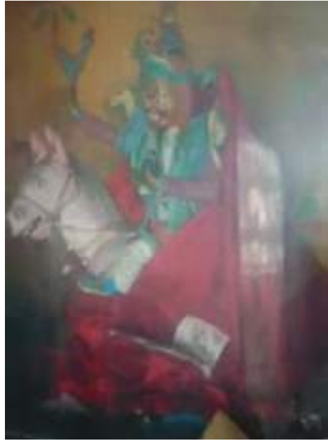
ལྷ་བཙན་འབར་བ་གི་སྒྲུ་འབྲ།