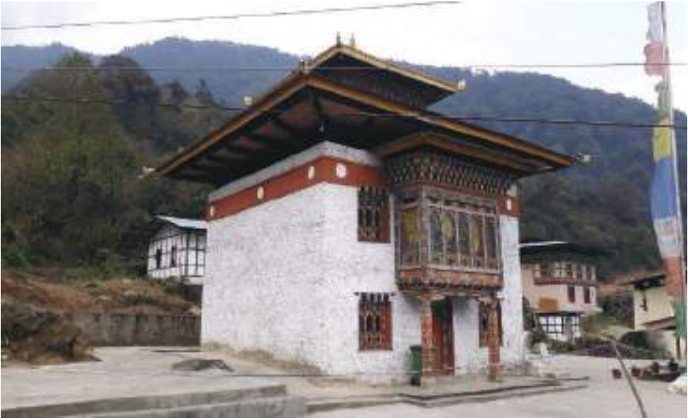
སྤྲོད་སྤྱི་སྤྱི་ལྷ་ཁང་གི་མཐོང་སྒྲུབ།