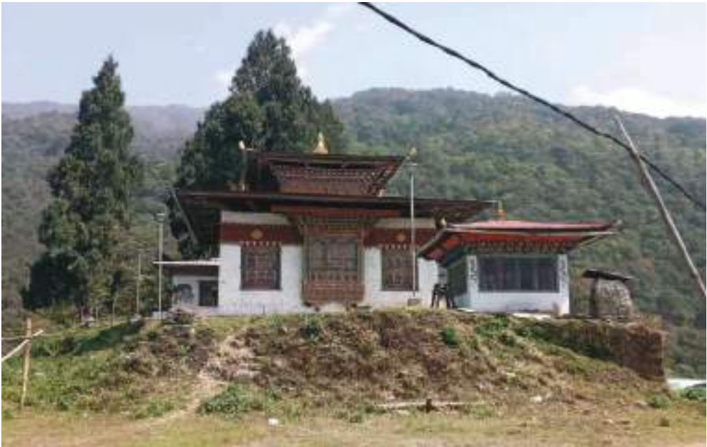
སྐྱར་དགོན་ལྷ་ཁང་གི་མཐོང་སྣང་།

དང་། ཤིན་པོའི་དགེལ་དགེ་ཙ་སྐྱབ་ས་ དེ་ལས་ སྐྱེས་ལྷ་ཡུལ་ལྷ་ཡུ་ གསོལ་མཆོད་ཕུལ་ནི་ཚུ་ག་ར་ལྷ་ཁང་ འདི་ནང་ལུ་ཕུལ་ཕྱ་ཨིན་ཟེར་བཤད་པའི་ཁར། གཡུས་ཚན་ཁག་ལྔའི་ནང་ལུ་ ཕུག་མཆོད་ཕུལ་ཏེ་གསོལ་ཕྱ་ བཏབ་སའི་རྟེན་ཟེར་རུང་ ཏེ་མ་ལས་སྐྱར་དགོན་ལྷ་ཁང་རྒྱུང་མ་ཅིག་མ་གཏོགས་ ལྷ་ཁང་གཞན་ བཞེངས་ བཞེངས་པ་ར་མིན་འདུག་ཟེར་བཤད་པ་ཨིན་པས།