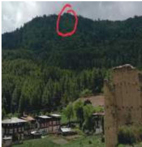
ལྷ་བཙན་གྱི་གསལ་ཁང་།

བྲག་དམར་བཙན་གྱི་གསོལ་མཚན་གྱི་ དམ་བཞག་ནང་ལས། (དཔར་ལོ་མེད་ རོག་གངས་ ༡གི་རྒྱབ་) “ཀྱི་འཆི་མེད་མགོན་པོ་པརྟ་ཀ་ར་དང་། བྲུབ་བརྟེས་བྲུ་མ་བརྟུད་པའི་སྐུན་སྡེ་རུ། བསྐྱེད་འགོ་སྦྱོང་བར་ཁས་བྲུངས་དམ་བཅས་པའི། བཀའ་དམ་སྐྱོན་འོ་བཙོལ་བའི་ཕྱིན་ལས་མཛོད།” ཟེར་དེ་སྟེ་ཐོན་དོ་བཟུམ་སྟེ་ འཆི་མེད་མགོན་པོ་པརྟ་ཀ་ར་གི་ བཀའ་དང་དམ་ལས་ནམ་ཡང་མི་འདའ་བར་ བསྐྱེད་པ་དང་དགོན་སྟེ་ཚུལ་བཞིན་སྦྱོང་མི་ཅིག་སྟེ་ དམ་བཞག་མཛོད་ཡོད་པ་སྟེ་ཡིན་པས།