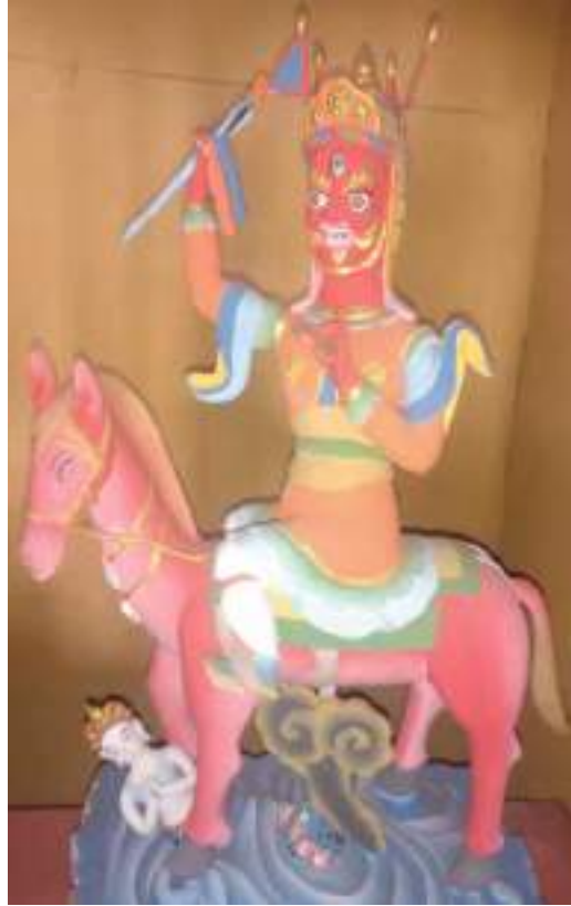
སྒང་བཙན་གྱི་སྐུ་འབྲུ་།