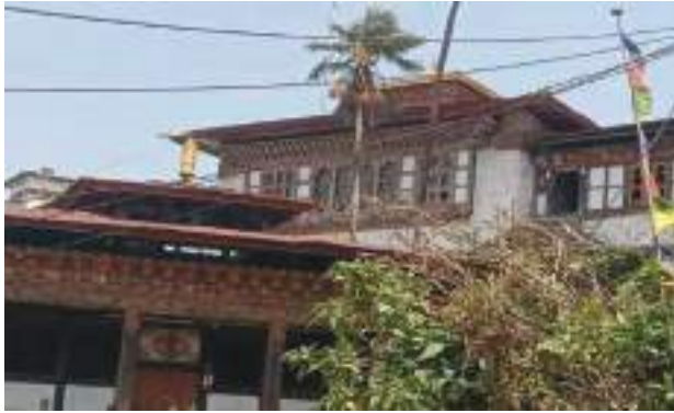
རྟོག་རྟོ་ཁའི་ལྷ་ཁང་།

ཡོད་པ་ཡིན་པས། མཐའ་འཁོར་ལུ་ སྤྲོན་བཙུན་མོ་བརྒྱུད་བསྐྱེད་མེད་ཆོག་གིས་བསྐྱོར་བའི་དབུས་སུ་མ་ངེས་ དུ་མའི་རྩུ་འཕུལ་སྟོན་ཞིང་ཡོན་མཆོད་དམ་ཆོག་ཟོལ་ཟོག་སོགས་སྤངས་པའི་མཆོད་པའི་ཡུལ་ལ་ཆགས་བཞིན་ པར་བཞུགས་ཡོད་པ་སྟེ་ མངོན་རྟོགས་དང་བསྟོད་པའི་ཆོག་ནང་ལས་གསལ་ཤ་ཡིན་པས།