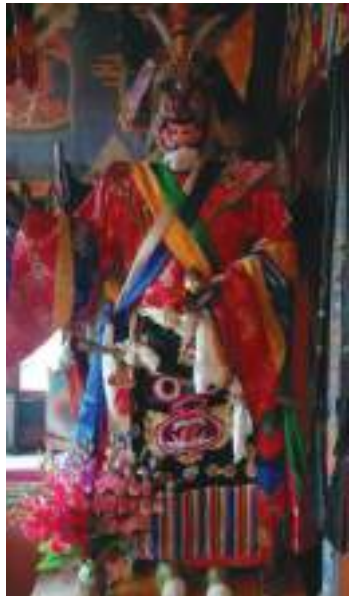
བྱི་ལི་བཅན་གྱི་གནས་ཁང་གི་མཐོང་སྣང་།