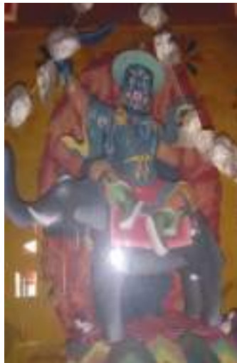
རྒྱལ་པོ་གི་ཀ་བྲལ།

མདོག་འབད་བ་ཅིན་ མཐིང་ནག་ ཡུག་གཡས་པ་ལུ་ སྤྱི་བསྐྱམས། གཡོན་པ་ལུ་ བདུད་ཞགས་བསྐྱམས་ སྤེ་ སྤང་ཆེན་ལུ་ཆིབས་ཏེ་གར་སྤྲུམ་གྱི་ཚུལ་དུ་བཞུགས་ཡོད་པ་ཨིན་པས། མཐའ་འཁོར་ལུ་ ཕྱོགས་བཞིའི་ རྒྱལ་པོ་བསམ་གྱི་མི་བྱབ་པར་ རྩོམ་གྱིས་བསྐྱོར་བའི་དབུས་སུ་ མ་ངས་དུ་མའི་རྩུ་འཕུལ་སྟོན་ཞིང་ཡོན་ མཆོད་ དམ་ཆོག་ཟོལ་ཟོག་སོགས་སྤངས་པའི་མཆོད་པའི་ཡུལ་ལ་ཆགས་བཞིན་པར་བཞུགས་ཡོད་པ་སྤེ་ མངོན་རྟོགས་ལས་གསལ་ཕྱ་ཨིན་པས།