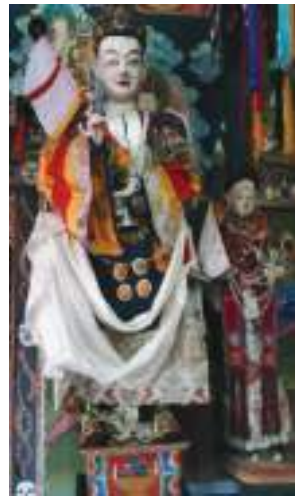
ལྷ་བཙན་དཀར་བླ་དང་སྟག་མོ།