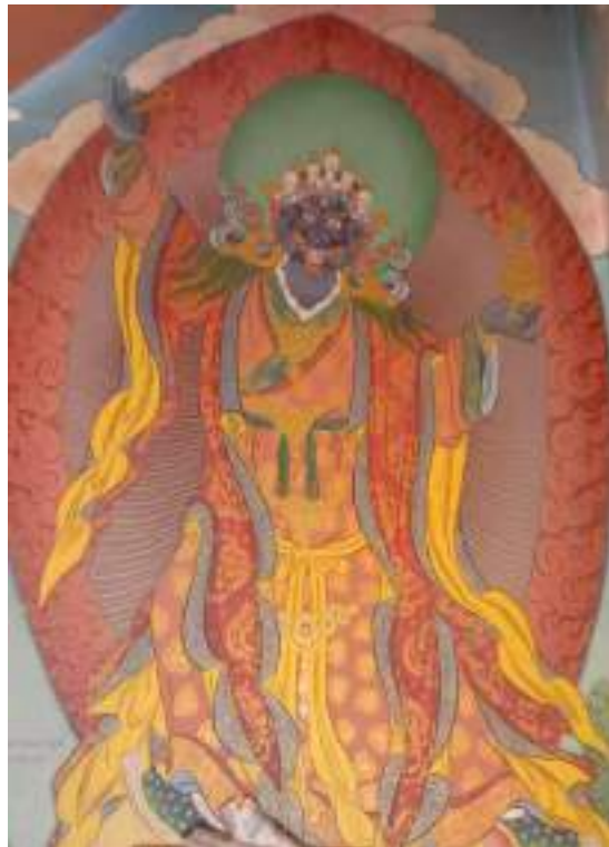
གཞི་བདག་གི་ལྷེབས་རིས།

གཡོན་པ་ལུ་མཚོག་མཐུན་གྱི་དངོས་གྲུབ་འབད་མེད་ ཆར་དུ་འབེབས་པའི་ཡིད་བཞིན་གྱི་ནོར་བུ་བསྐྱམས་ཏེ་ སྐྱུ་ལུ་དར་དམར་པོའི་འཛེལ་བེར་ཉེས་བརྟེན་སུ་གསོལ་མགུལ་རྒྱན་འབད་བ་ཅིན་ རིན་ཆེན་དོ་གལ་མགུལ་ ལུ་འཆང་ཞིང་ཕྱ་ཚོམ་གྱི་རྒྱན་ཆས་སོགས་ སྐར་ཚོགས་བཟུམ་འོད་ཆེས་ཆེས་སྟེ་ གར་སྟབས་ཀྱིས་འགྱིང་ཞིང་ རོལ་པའི་རྒྱལ་དུ། འཁོར་སྐྱུ་བཙན་བདུད་གཟའ་སྦྲན་མོ་སོགས་ཀྱིས་བསྐྱོར་ཏེ་ སྤྱིད་པ་གསུམ་པོ་འགུལ་རུས་ པའི་ལྷས་ཆེན་པོ་བཙོ་བརྒྱད་དང་བཙས་པའི་རྒྱལ་དུ་བཞུགས་ཡོད་པ་སྟེ་ཨིན་པས།