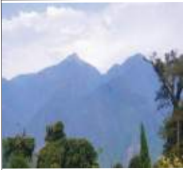
མཐོང་སྤང་དང་པ།