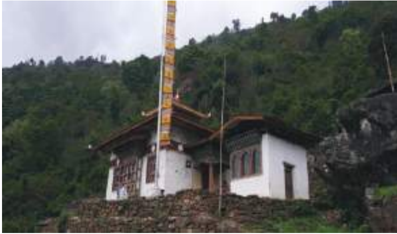
ཅུང་ལ་ལྷ་ཁང་གསར་པ།