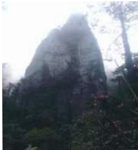
མཐོང་སྤང་གསུམ་པ།