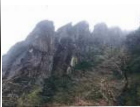
མཐོང་སྤང་གཉིས་པ།