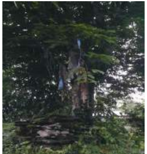
ལྟ་བཙན་གྱི་གནས་ཁང་མཐོ་ལ་གི་མཐོང་སྣང་།