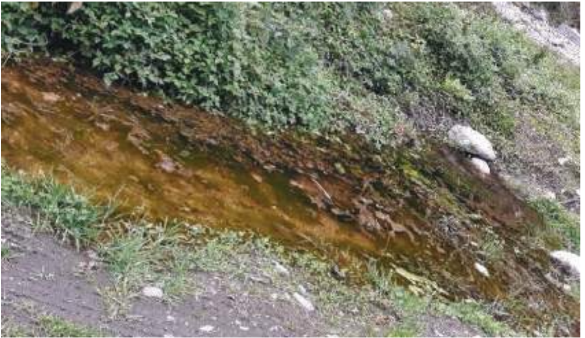
རོང་རྩུའི་བྱུར་ཁར་ཡོད་པའི་གཞི་བདག་གི་སྒྲ་མཚོ།