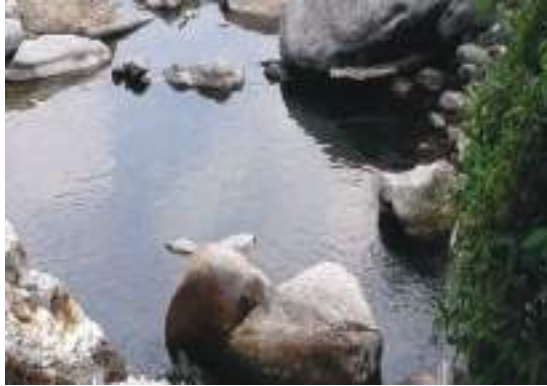
རོང་རྩེ་གི་སྤྱོད་མོ་ལག་རིང་མོ་གི་སྤྲུལ་མོ།

ལས་ཁ་ཡར་ལྷ་ལྷ་མ་ད་ ཤིང་དང་ནགས་ཚལ་གྱིས་གང་སྟེ་ རི་སྒོམ་སྟེ་མཐོང་ནི་ཡོད་མི་འདི་ སྤྱོད་མོ་ལག་ རིང་མོ་གི་གནས་ཁང་ འབྲིགས་བྱེད་རི་བེར་ སྤྲུལ་མི་འདི་ཡིན་ཟེར་བཤད་ནི་འདུག།