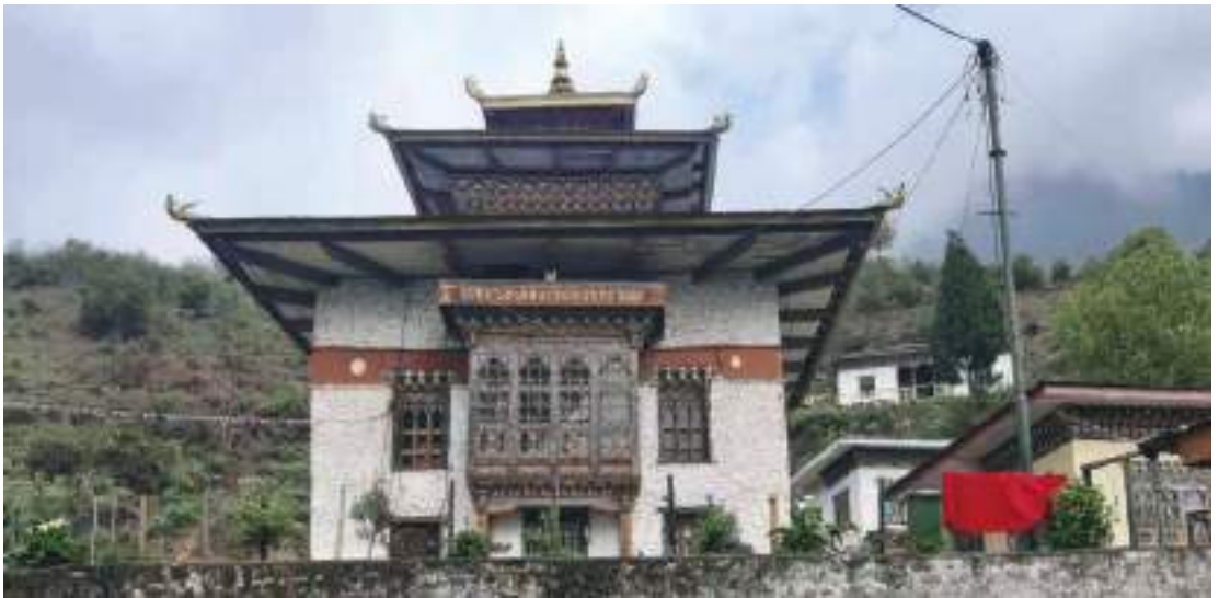
རྒྱ་ཕྱོགས་རྒྱལ་བ་རིགས་ལྡའི་ལྷ་ཁང་གི་མཐོང་སྒྲུང་།

ཁའི་མི་ཚུ་ལུ་ བདའ་གཏང་ཚར་ཕ་ཅིག་ ཕུར་པའི་སྐུ་འབྲེ་འདི་ ཕུར་ཏེ་འདི་ནང་བྱོན་ཅུག། ཁོ་རའི་ལུང་བསྟན་ འདི་ནང་ཡོད་པ་ཨིན་མས་ཟེར་གསུངས་ཏེ་ ས་གནས་དེ་ཁར་ལྷ་ཁང་བཞེངས་ཞིན་མ་ལས་ ཕུར་པའི་སྐུ་འབྲེ་ འདི་ ནང་རྟེན་སྡེ་བཞུགས་སུ་གསོལ་ཅུག། རྒྱ་མཚན་དེ་ལུ་བརྟེན་ཏེ་ རྒྱ་ཕྱོགས་རྒྱལ་བ་རིགས་ལྡའི་ལྷ་ཁང་ གི་གདན་ས་བཅགས་གནང་མི་ དཔལ་ཆེན་གཞོན་ནུའམ་ཕུར་པ་འདི་ཨིན་མས་ཟེར་ ལྷ་ཁང་གི་སྒྲུལ་ཨོ་རྒྱན་ ཐིན་ལས་ཀྱིས་བཤད་ནི་འདུག།