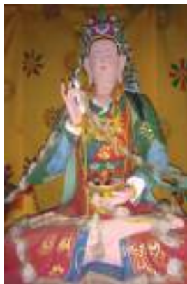
ཨམ་ནོར་བཟང་རྒྱལ་མོའི་སྐྱེ་འདྲ།

གཞི་བདག་གསོལ་མཆོད་ཀྱི་ དམ་བཞག་ནང་ལས། (དཔར་ལོ་མེད་ཤོག་གངས་ ༥པར་) “ཀྱི་། སྟོན་ཆེ་ རིག་འཛིན་པ་རྣམས། །དབང་བསྐྱར་དམ་ལ་བཏགས་པ་ནི། །བསྟན་པ་བསྐྱར་བར་བཀའ་བསྐྱོས་པའི། །དམ་ བཅའ་མ་གཡེལ་འཕྲིན་ལས་མཛོད། །བར་དུ་ཐང་སྟོང་རྒྱལ་པོ་དང་། །འབྲུག་སྐྱོ་དོ་རྩེ་ལ་སོགས་གྱིས། །འགྲོ་ལ་ སན་བདེ་སྐྱབ་པ་རུ། །བསྐྱོས་པའི་ཐཱ་ཆོག་བྲམ་པར་མཛོད། །ད་ལྟ་ནལ་འབྱོར་བདག་ཅག་གིས། །མཆོད་བསྟོད་ དམ་ཆོག་བྲན་ལགས་ན། །དམ་ལུན་བྱ་བཞིན་སྟོང་བ་དང་། །སྤྱིན་བདག་བསམ་དོན་གྲུབ་པར་མཛོད།” ཟེར་ དེ་སྟེ་ཐོན་དོ་བཟུམ་སྟེ་སྟོན་ཆེ་རིག་འཛིན་པ་རྣམས་འགྲུབ་པར་མཛོད།