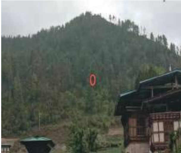
ལྷ་བཙན་གྱི་གནས་ཁང་།

ཕྱོགས་གཞོམས་པའི་ལུ་ལུ་རམས་པར་བཞུགས་ཡོད་པ་སྟེ་ བསྟོད་པ་དང་མངོན་རྟོགས་ཀྱི་ཆོག་ནང་ལས་ གསལ་ཁྱ་ཡིན་པས།