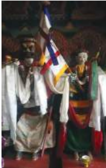
ཕོ་ལྷ་གཏེར་ཆེན་གཞི་བདག་དང་མཚོ་སྤྱན་མོའི་ཀ་ཁབ།

འཁོར་ཚོགས་ གངས་མེད་ཀྱིས་བསྐྱོར་ཏེ་བཞུགས་ཡོད་པ་སྟེ་ མངོན་རྟགས་དང་བསྟོད་པའི་ཚིག་ནང་ལས་ གསལ་ལྟ་ཡིན་པས།