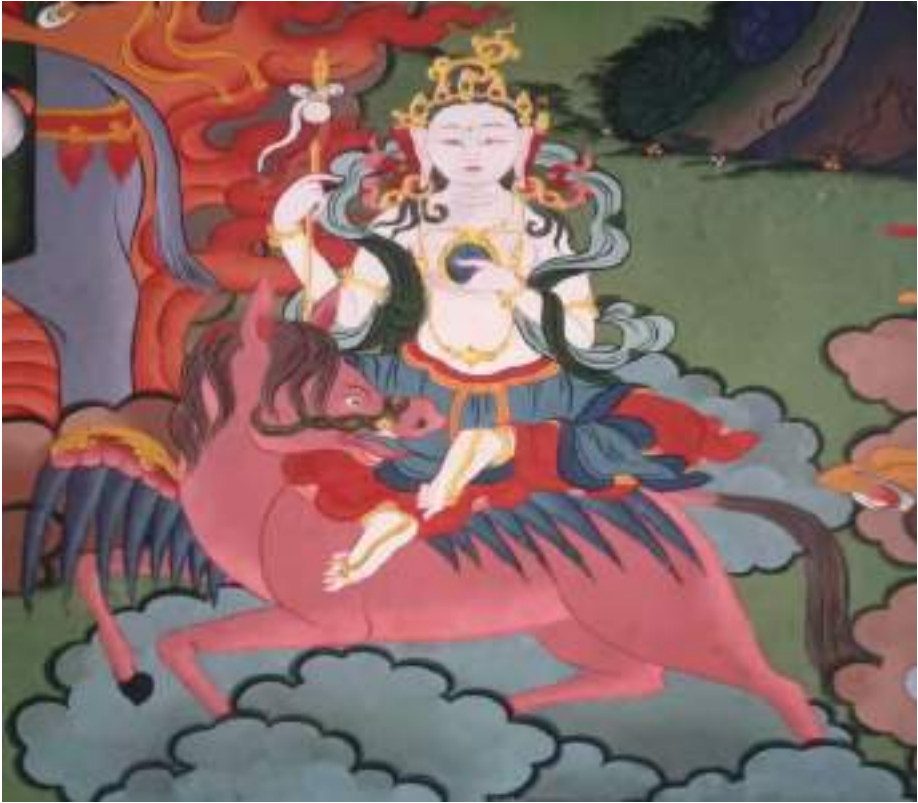
ལྷ་བཙན་བློ་གཏེགས་མོ།