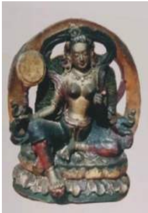
གནས་བདག་ཞིང་སྟོང་དབང་མོའི་སྐུ་འདྲ།

གྲིས་རོལ་པར་གྱུར།”ཟེར་ གསོལ་ཁ་ནང་ལས་གསལ་དོ་བཟུམ་སྟེ་ ལྷ་མོའི་སྐུ་མདོག་འབད་བ་ཅིན་ མེ་ཏྲོག་ཀྱ་ ལུ་ཏའི་སྟོང་པོ་བཟུམ་སྟེ་ དཀར་པོ་སྟེ་ཡོད་པའི་གྱུར་བརྒྱུད་གཉིས་བཅུ་དྲུག་ལང་ཚོ་ལྟན་པའི་ ཞལ་འཇུག་ པའི་ཉམས་དང་བཅས་པ་སྟེ་ཕྱག་གཡས་པ་ལུ་ ཤེལ་གྱི་རྩ་བ་སྐྱམས། གཡོན་པ་ལུ་ གསེར་གྱི་འུ་ལུ་ (རྩ་ཁྱུང་)བསྐྱམས་ཏེ་བརྒྱུད་བའི་ཚུལ་དུ་མཛད་པའི་ སྟེག་པའི་ཉམས་གྲིས་བཞུགས་པའི་གྱུར་འཁོར་འབད་བ་ ཅིན་ མདུན་དུ་ཉ་ཡིག་ལས་དོ་རྩེ་མཁའ་འགོ་སྟོན་མོ། ལྷོ་ཁ་ཐུག་ལུ་ རི་ཡིག་ལས་རིན་ཆེན་མཁའ་འགོ་སེར་ མོ། རུབ་གྱི་ཁ་ཐུག་ལུ་ བེ་ཡིག་ལས་པརྟ་མཁའ་འགོ་དམར་མོ། བྱང་ཁ་ཐུག་ལུ་ ས་ཡིག་ལས་ལས་གྱི་མཁའ་ འགོ་ལྗང་མོ། དེ་ཚུ་ག་ར་གིས་ཡང་ ལྷའི་ན་ཁྱུང་ཡིད་དབང་འཕྲོག་པའི་ གཡས་རིན་པོ་ཆེ་དང་ གཡོན་དདུལ་ དཀར་གྱི་མེ་ལོང་འཛིན་ཅིང་རྒྱན་ཐམས་ཅད་གྲིས་བརྒྱན་ནས་ གཙོ་མོ་ལ་འདུད་པའི་ཚུལ་གྱིས་བཞུགས་པ། ཕྱི་ རོལ་གྱི་སྟེང་ཚལ་དུ་ཞིང་སྟོང་གི་མཁའ་འགོ་བྱེ་བ་འབུམ་སྟེའི་ཚོགས་དང་བཅས་པ་སྟེ་བསྐྱོར་ཏེ་བཞུགས་ཡོད་པ་ སྟེ་ མདོན་རྟོགས་གྱི་ཚོག་ནང་ལས་གསལ་ལྟ་ཨིན་པས།