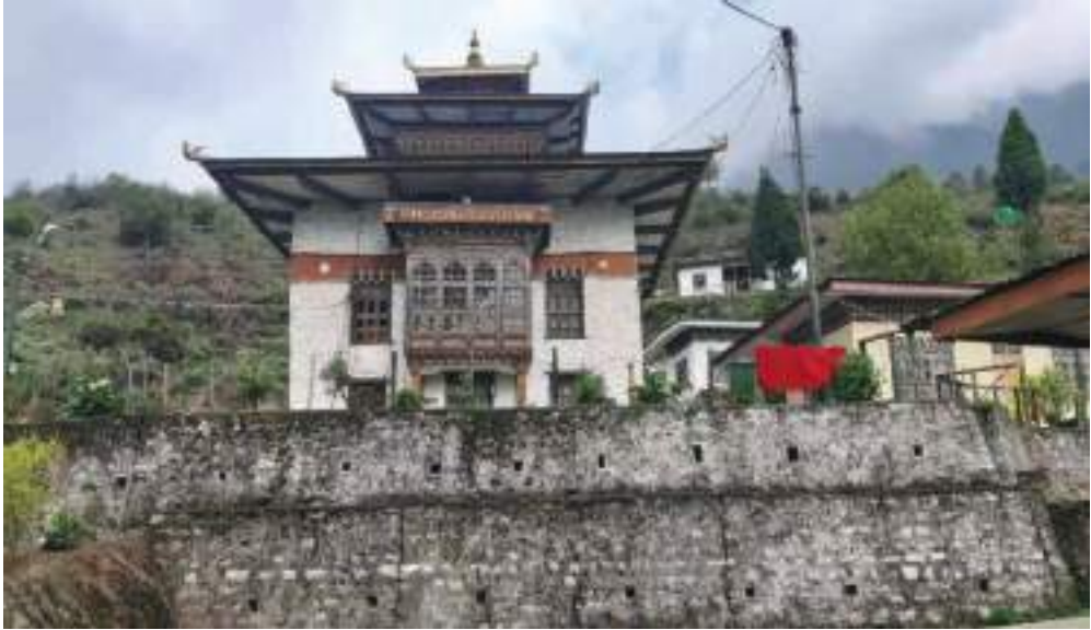
བྱག་ཕྱོགས་རྒྱལ་བ་རིགས་ལྷ་ཁང་གི་མཐོང་སྣང་།

དེ་ལས་སྐྱམ་གིས་དེ་འཕྲོ་ལས་ར་ མི་སེར་ཚུ་བཀྲག་ཞིན་མ་ལས་དཔལ་ཆེན་དོ་རྩེ་གཞོན་ཅུའི་ཡུང་བསྟན་འདི་ བྱང་ཡོད་པ་ཡིན་མས་ཟེར་གསུངས་ཏེ་ ས་གནས་དེ་ཁར་ལྷ་ཁང་བཞེངས་ཞིན་མ་ལས་ སུར་པའི་སྐྱུ་འབྲེ་འདི་ བྱང་རྟེན་སྤེལ་བཀའ་སྲུ་གསོལ་ཅུག། རྒྱ་མཚན་དེ་ཡུ་བརྟེན་ཏེ་ བྱག་ཕྱོགས་རྒྱལ་བ་རིགས་ལྷ་ཁང་གི་ གདན་ས་བཅགས་གནང་མི་དཔལ་ཆེན་གཞོན་ཅུའམ་ སུར་པ་འདི་ཡིན་མས་ཟེར་ ལྷ་ཁང་གི་སྐྱམ་ཨོ་རྒྱལ་ཕྱིན་ ལས་ཀྱིས་བཤད་ནི་འདུག།