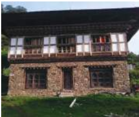
ས་ཕྱོགས་བཙན་མཚན་པའི་བྱིས་

རྟེན་འོག་དེ་གི་འོག་ལུ་ མི་སྒྲོལ་ས་་ ༧༠༠ ལྷག་པ་ཅིག་གི་ནང་ལུ་ བྱིས་གུང་པ་ ༡༥༠ དང་སྤྱི་འོག་ ༥ དེ་ཅིག་ ཡོད་པ་ཨིན་པས། རྟེན་འོག་ལྷེ་བ་ལས་ མོན་ལོ་ཁ་གཡུས་ཚན་ལུ་ རྟེན་སྒྲོང་སྤྱོད་གོ་པ་ཅིན་ ཏུས་ཡུན་ཚུ་ ཚོད་ ༡ དང་ ༣ དེ་ཅིག་འབྱོར་གོ་པ་དང་། ལྷུ་མ་འཁོར་ནང་འབད་བ་ཅིན་ ཚུ་ཚོད་ ༡ དེ་ཅིག་འབྱོར་གོ་པའི་ ས་ཁར་ཆགས་ཏེ་འདུག། ཏེ་མ་འབད་བ་ཅིན་ རང་ལྷན་ ༡༡ པའི་ཆོས་ ༥ ལུ་ གཡུས་སྒོ་འདི་ནང་གི་མི་ཚུ་ ག་ར་ག་ཅིག་ཁར་འཛོམས་ཞིན་མ་ལས་ དཔའ་བོ་གིས་སྤྱོད་ ལོ་ལྷར་བཞིན་ཏུ་འཁྱི་ ལྷག་པའི་བཙན་ལུ་ དཀར་ མཚན་གྱི་ཐོག་ལས་མཚན་ནིའི་ལུགས་སྤོལ་ཡོད་ཟེར་བཤད་ནི་འདུག།