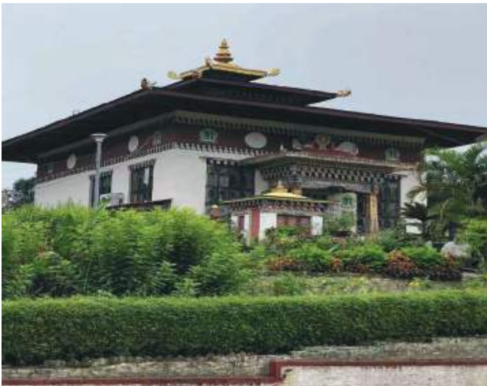
རིན་ཆེན་ལྷིང་ཀུན་དགའ་ཆོས་སྒྲིང་དགོན་པའི་ལྷ་ཁང།

གྱི་ལོ་ལུ་ལྷ་ཁང་ཕྱི་ནང་གི་འགོ་སྐང་མ་དངུལ་ཡོངས་རྫོགས་གནང་སྟེ་བཞེངས་ཡོད་པ་ཡིན་མས། ལྷ་ཁང་གསར་བཞེངས་ཀྱི་ ཕུག་ལུ་གནང་མ་ད་ འགོ་འབྲེན་གཙོ་བོ་ རྗེ་མཁན་ཁྲི་རབས་ ༤༥ པ་ཞིང་ གཤེགས་ སྐབས་རྗེ་ཁྲི་ཟུར་བསྟན་འཛིན་དོན་གྲུབ་མཆོག་དང་ རྒྱལ་ཡུམ་མོ་རའི་སྐུ་སྒྲེར་བྱང་ཆེན་ སྟོབ་ དཔོན་ཕུར་པ་དོ་རྗེ་ནམ་གཉིས་ཀྱིས་ མ་བརྟབ་བརྟབ་སྟེ་འགོ་འབྲེན་མཛད་དེ་ ལྷ་ཁང་གི་ནང་རྟེན་དབུས་སུ་ བདག་ཅག་གི་སྟོན་པ་སངས་རྒྱུ་ཤུག་ཕུབ་པའི་སྐུ་འབྲུ་ རོ་བོ་སྟོན་ལམ་གང་བཏབ་མ་ཟེར་ རང་གི་དད་པ་དང་ མོས་གུས་བསྐྱེད་དེ་སྟོན་ལམ་བཏབ་པ་ཅིན་ བྱ་འདོད་པ་ལ་བྱ་དང་ ཁོར་འདོད་པ་ལ་ཁོར་ཐོབ་ནི་འདི་གིས་ ང་ བཅས་འབྲུག་པའི་མི་ཚུ་གིས་མ་ཆད་པར་ རྒྱ་གར་ཀལ་ཀ་ཏ་ལས་ཚུར་ གནས་བསྐྱོར་རྒྱབ་མི་མང་སུ་འོང་ནི་ ཡོད་ཟེར་བཤད་པ་ཡིན་པས།