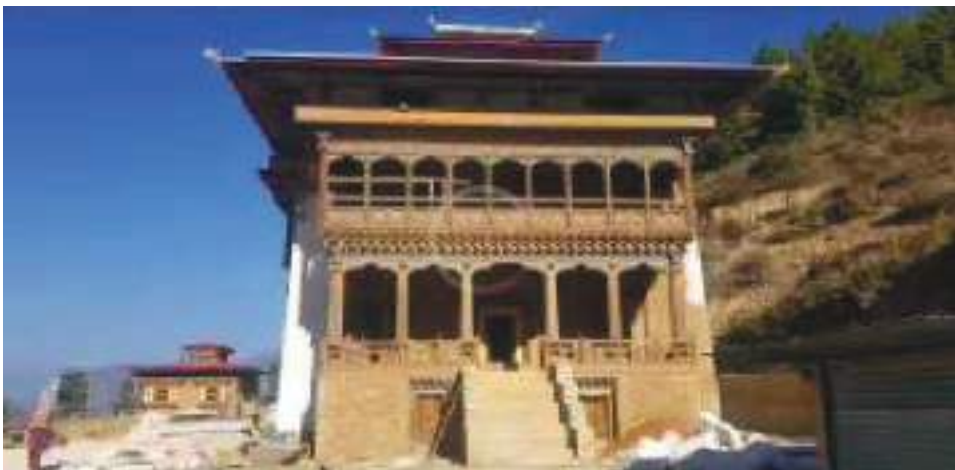
ལྷ་ཁང་གསར་པ་བཞེངས་པའི་བསྐང་།