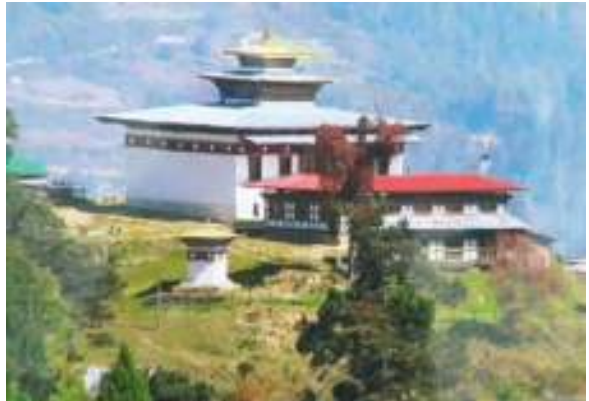
དགེ་ལེགས་དགོན་པ།