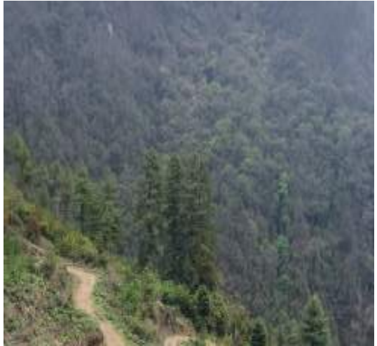
གནས་ཁང་རྒྱལ་བ་རིགས་ལྗེའི་མཐོང་སྣང་།