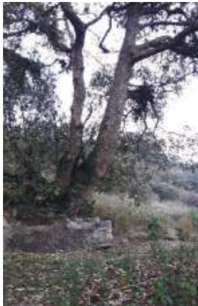
དགྲ་ལྷའི་གནས་ཁང་གི་མཐོང་སྣང་།

གནས་ཁང་འབད་བ་ཅིན་ སྐྱེན་འབྲེན་ལས། (དཔར་ལོ་མེད་ འོག་༥པར་)“རྒྱུ་ རང་བཞིན་ཡོངས་ཤེས་ཆོས་ སྐྱེ་ཐིག་ལེའི་གྲོང་། །མ་འགགས་གདོད་ནས་ལྷན་གྲུབ་ལོངས་སྐྱེའི་ཁིང་། །ཀུན་བྱབ་ཅི་འཆར་སྤུལ་སྐྱེའི་གཞུལ་ ཡས་སོགས། །བཀོད་ལེགས་ཕུན་ཚོགས་འཆི་མེད་ལྟ་ཡི་གྲོང་། །སྤུམ་ཅེན་ནམ་པར་རྒྱལ་བའི་ཁང་བཟང་ བཞིན།” ཟེར་གསལ་དོ་བཟུམ་སྤེལ་ སྤྲད་སྤྱི་སྤྱི་འོག་གི་ལྷ་ཁང་རྒྱབ་ལས་ རྟགས་ཚལ་ནང་ལས་སྤེལ་ ཁ་ཡར་ ལྷ་གྲེན་འཛེགས་ཏེ་ ཅུས་ཡུན་སྐར་མ་༥ དེ་ཅིག་གི་རིང་ལུ་ ཀླང་སྤོང་སྤེལ་འགྲེལ་ད་ དགྲ་ལྷའི་གནས་ཁང་ཡོད་ སར་སྤོད་པ་ཡིན་མས། སྤྲད་སྤྱི་གཡུས་ཚན་གྱི་ ཁྱིམ་གྲུང་པ་༥༡ གི་མི་སེར་ཚུ་ག་ར་གཅིག་ཁར་འཛོམས་ ཞིན་མ་ལས་ ལོ་ལྷར་བཞིན་རུ་ ཅུས་ཚོད་གྲུ་ལུ་མ་ཆད་པར་ གསོལ་མཆོད་ཆར་གཉིས་རེ་སྤུལ་ནི་ཡོད་ཟེར་ ལྷ་ཁང་གི་དགོན་གཉེར་ཉིན་མ་རྩེ་གིས་བཤད་པ་ཡིན་པས།