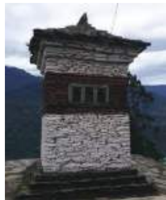
མཆོད་རྟེན་གྱི་མཐོང་སྒྲུང་།

སྐང་བཙན་བཀྲ་ཤིས་རབ་བརྟན་གྱི་བཞུགས་ཁང་བཟུམ་ཅིག་འབད་བ་ཅིན་ དགོན་པའི་ལྷ་ཁང་ནང་ལུ་མེན་པ་ རྟེ་མ་ གཏུང་ན་སྐྱ་མ་གྲགས་པ་རྒྱ་མོ་མཆོག་གིས་བཞེངས་བཞེངས་པ་ ཨིན་ཟེར་བའི་ མཆོད་རྟེན་གཅིག་མཇུག་ནི་ཡོད་པའི་ སྐྱ་རུང་ནང་ ལུ་ དོན་ག་གུ་ པ་ཏ་བཞོ་སྟེ་བཅུགས་ཡོད་པའི་ གནས་པོ་གི་སྐྱ་པར་ རི་མོའི་ཐོག་ལུ་རྒྱུང་མ་གཅིག་མཇུག་ནི་ཡོད་པ་མ་གཏོགས། གནས་པོ་ གི་སྐྱ་འབྲ་དང་ ཀ་ཁབ་ དེ་ལས་ལྷེབས་རིས་ལ་སོགས་པ་ཚུ་ ག་རྟེ་ ཡང་མ་མཐོང་ཟེར་ གཏུང་ན་གྲགས་གིས་བཤད་པ་ཨིན་པས།