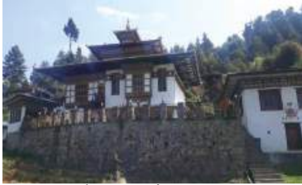
ཕྱི་མ་ཁ་ལྷ་ཁང་གི་མཐོང་སྒྲུང་།