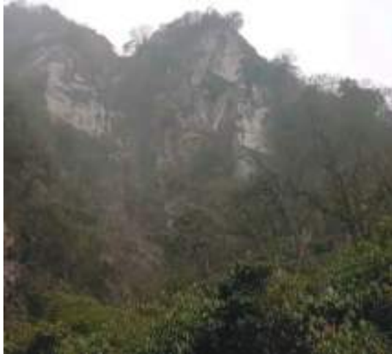
དཀར་བྲག་གནས་ཁང་།

གྲིས་མི་བྱུང་པའི་ ལྷ་ཁྱུ་བདུད་བཙན་སོགས་ཀྱིས་བསྐྱར་ཏེ་བཞུགས་ཡོད་པ་སྤེམ་མངོན་རྟོགས་དང་བསྟོན་པའི་ ཆོག་ནང་ལས་གསལ་ཤིང་ཡིན་པས།