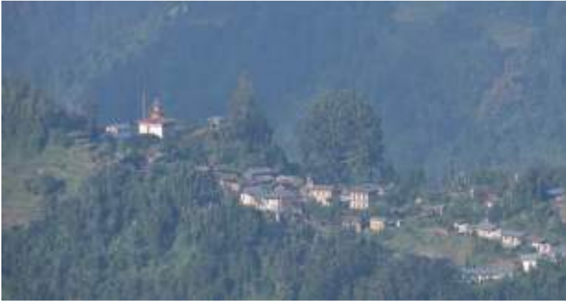
མེ་རི་ཕྱེ་མོའི་ལྷ་ཁང་གི་མཐོང་སྒྲུང་།

མོ་ལུ་བྱོན་པའི་སྐབས་ ལྷ་ཁང་གི་མིང་གསར་པ་ཐེག་ཆེན་འོད་གསལ་ཚས་གླིང་ཟེར་ མཚན་གསལ་གནང་ ཡོད་པ་སྟེ་བཤད་པ་ཡིན་པས།