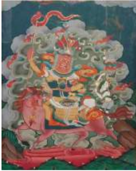
བྲག་དམར་བཅན།