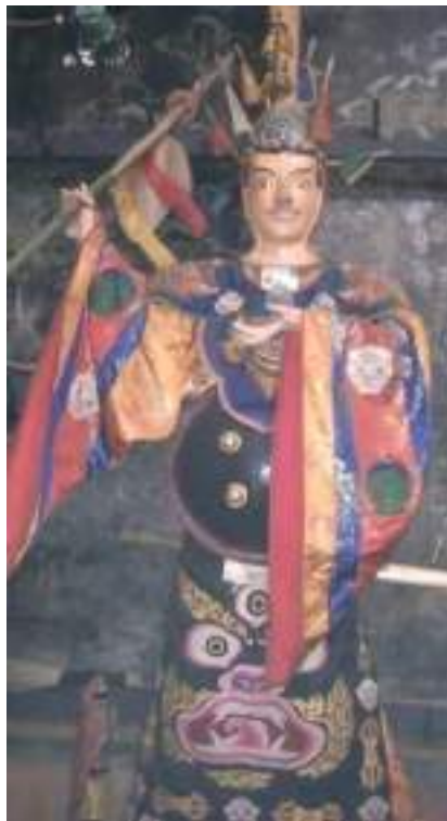
ལྷ་བཅན་རི་བཅན་དཔལ་ལྷའི་ཀ་ཁྲབ།

སྒྲེ་ ཞལ་འཇུག་པའི་ཉམས་དང་བཅས་པ་སྒྲེ་ སྐུ་ལུ་ན་བཟའ་ ཟ་འོག་གི་བེར་དང་ དར་སྒྲ་ཆོགས་གྲིས་གསོལ། ཟུག་གཡས་པ་ལུ་དར་བ་དན་དཀར་པོ་གནམ་ལུ་འཕྱར། གཡོན་པ་ལུ་མཆོག་ཐུན་གྱི་དངོས་གྲུབ་ འབད་མེད་ ཆར་དུ་འབེབས་པའི་ ཡིད་བཞིན་གྱི་རྩོམ་བྱ་བསྐྱམས་ཞིན་མ་ལས། དུས་མཐའི་རླུང་ཤུགས་ལས་ཀྱང་མགྱོགས་ པའི་ཆིབས་ ཏྲ་ཅང་ཤེས་གུར་ཆིབས་ཏེ་ སྟོང་གསུམ་དུས་ཡུན་སྐད་ཅིག་གཅིག་ལུ་བསྐྱོར་ནས་ དཔའ་བོའི་ ཉམས་དང་ལྡན་པར་འགྱིང་སྒྲེ་བཞུགས་ཡོད་པ་ཨིན་པས། གསང་བའི་ཡུམ་ཆེན་ སྤྲན་མོ་ལང་ཆོ་བརྒྱད་གཉིས་ལོན་པ་ ཞལ་འཇུག་ལྟ་བུའི་ཆོག་མི་ཤེས་པར་ ལམས་ གསུམ་གྱི་ཡིད་འཕྲོག་ཅིང་ དཀར་ལ་དམར་བའི་མདངས་དང་ལྡན་པ། འཁོར་སྤྱས་དང་བཅས་པ་ བསམ་ གྲིས་མི་བྱལ་པའི་ ལྷ་ལྟ་བུ་བདུད་བཅན་སོགས་གྲིས་བསྐྱོར་ཏེ་བཞུགས་ཡོད་པ་སྒྲེ་ བསྟོད་པའི་ཆོག་ནང་ལས་ གསལ་ལྟ་ཨིན་པས།