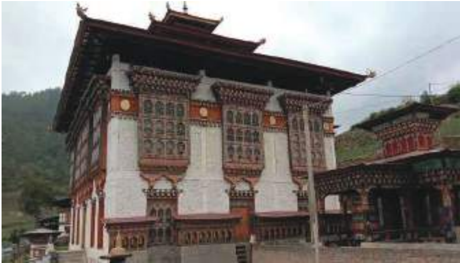
སྤང་ཁ་བསོད་ནམས་ཅེ་ལྷ་ཁང་།

སྤང་ཁ་གཡུས་ཚན་གྱི་མི་ཚུ་གིས་ བོ་ལྷ་གནམ་ཐེད་དཀར་པོ་དེ་ སྤྲེས་ལྷ་ཡུལ་ལྷ་སྤེལ་བསྟན་ནི་འདི་གིས་ མི་ཚུ་ གིས་ཕྱག་དང་མཆོད་པ་ལུ་ཏེ་ སྐབས་དང་མགོན་ལུ་ནི། གཤིན་པོའི་དགེ་ལྡན་གེ་ཅུ་བསྐྱབ་ནི་དང་ སྤྲེས་ལྷ་ ཡུལ་ལྷ་གསོལ་ནི་ཚུ་ ག་ར་ལྷ་ཁང་དེ་ནང་ལུ་ལུ་ལོ་ཡོད་པ་སྤེལ་བཤད་ནི་འདུག།