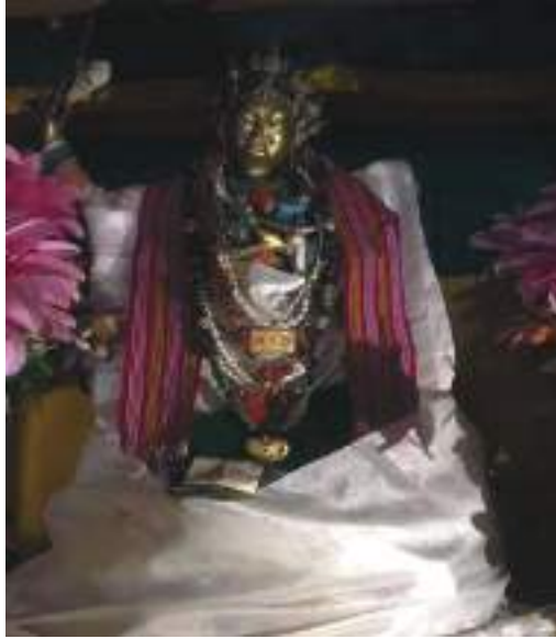
ཨམ་དཀར་མིའི་སྐུ་འདྲ།