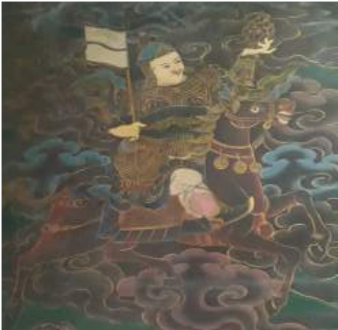
ལྷ་བཙན་གྱི་ལྷེབས་རིས།

སོགས་པ་ རིན་པོ་ཆེ་རྣམ་པ་སྣ་ཚོགས་པའི་རྒྱལ་ཁྲིས་བརྒྱན་ཡོད་པའི་ཐོག་ལུ་ཆིབས་ཞིན་མ་ལས་ ལྷོང་གསུམ་ དུས་ལུན་སྐད་ཅིག་གཅིག་ལུ་བསྐྱོར་ཏེ་ དཔའ་བོའི་ཉམས་དང་ལྡན་པར་འབྱིང་སྟེ་བཞུགས་ཏེ་ཡོད་པ་ཡིན་པས། དེ་གི་གཡོན་ཁ་ཐུག་ལུ་ བདེ་ལྷོང་ཅེ་དགའི་འཁྲི་ཤིང་ སྤུང་མོ་ལང་ཆོ་བརྒྱད་གཉིས་བཅུ་དྲུག་ཡོན་མི་གི་སྐུ་ མདོག་འབད་བ་ཅིན་ དཀར་པོ་སྟོན་ཀའི་ལྷམ་ཉ་གང་གང་མ་བཟུམ་སྟེ་ ཞལ་འཇུག་ལང་ཆོ་རྒྱས་ཏེ་ སྐུ་ལུ་ན་ བཟའ་དར་དང་རིན་པོ་ཆེ་རྣམ་པ་སྣ་ཚོགས་ཁྲིས་བཞེས། རྒྱག་གཡས་པ་ལུ་མདའ་དར་བསྐྱམས། གཡོན་པར་ ཡིད་བཞིན་ལོར་བྱ་གང་བའི་གཞོང་པ་བསྐྱམས་ཏེ་ཡོད་པའི་གྲུ། འཁོར་འབད་བ་ཅིན་ལྷ་སྐུ་བདུད་བཙན་སྤུང་ མོའི་འཁོར་ཆོགས་ གངས་མེད་བསམ་ཁྲིས་མ་བྱབ་པར་བསྐྱོར་ཏེ་བཞུགས་ཡོད་པ་སྟེ་ མངོན་རྟོགས་དང་བསྟོན་ པའི་ཆོག་ནང་ལས་གསལ་ཕྱ་ཡིན་པས།