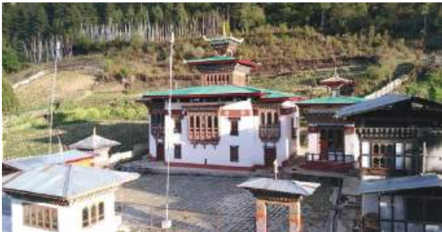
ཤེལ་ཡུལ་གྱི་དཀར་གསལ་ལྷ་ཁང་།

གཤམ་པོའི་དགེལ་དགེ་ཙ་བསྐྱབ་ནི་དང་ སྐྱེས་ལྷ་ཡུལ་ལྷ་གསོལ་ནི་ཚུ་ གོང་གི་ལང་གསུམ་ཆ་རའི་ནང་ལུ་ ཕུལ་བར་འོང་ནི་ཡོད་ཟེར་བཤད་པ་ཡིན་མས།