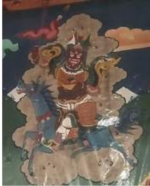
པོ་ལྷ་ནག་ཆེ།

གནས་ཁང་འབད་བ་ཅིན་ སྤྱན་འབྲེན་ལས། (དཔར་ལོ་མེད་ ཤོག་གངས་ཀྱི་རྒྱལ་) “ཀུན་བྱུང་རྩལ་བྲལ་རང་ བཞིན་ཆོས་དབྱིངས་གྲོང་། །རང་རིག་འགག་མེད་སྤྱོད་ཆོག་སྤྱོད་མེད་འཕྲུལ། །བྱུང་འབྱུང་རྩལ་གར་སྤྲིད་པའི་ རྩེར་བཞེངས་པ། །མཐུ་ལྷན་དགེ་བསྟེན་ཇོ་པོ་ནག་ཆེན་པ།” ཟེར་གསལ་དོ་བཟུམ་སྟེ་དགོན་པའི་ལྷ་ཁང་ལས་ ཁ་ཡར་བལྟ་སྟེ་ ཉིན་མ་ཕྱེད་ཀ་དེ་ཅིག་འགྲོ་དགོས་མ་ཆད་ གནས་ཁང་འདི་ རི་འདི་གི་རྒྱལ་ཁར་འབད་ནི་འདི་ གིས་ པར་ཡང་བཏབ་ཚུགས་པ་སྟེ་མིན་འདུག།