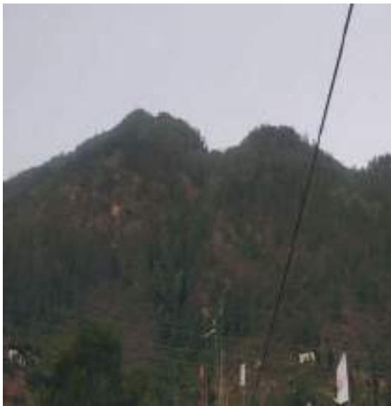
ཕོ་ལྷའི་གནས་ཁང་།

དཀར་ཞིང་འཇུག་པའི་ཞལ། རྣམ་པར་ཕྱེད་པའི་ཉིན་ཕྱེད་ཀྱི། ཁེ་མཐུན་ཐུན་པ་སྟོམས་མཛད་པའི། ལྷ་ བཙན་ཆེན་པོ་ཁྱེད་ལ་བསྟོད། ཕྱག་གཡས་ལྷ་ཡི་བ་དན་དང་། གཡོན་པ་རེན་ཆེན་འཛིན་པའི་མཐུས། སྐྱེས་ དགའི་ཕོངས་པ་སེལ་མཛད་པའི། འདོད་དགའི་ཆར་འབབས་མཛད་ལ་བསྟོད། མཚར་སྒྲུག་ལང་ཆོད་པལ་ ལྷན་མ། སྐྱིན་འཁྱོག་དུ་མའི་རྣམ་འགྱུར་གྱིས། སྲིད་གསུམ་གྲུབ་པའི་སྐྱིན་ལེགས་འབུམ། རྣམ་ཀྱན་རོལ་ ཅིང་མཛད་ལ་བསྟོད།། ཟེར་གསོལ་ཁ་ནང་ལས་གསལ་དོ་བཟུམ་སྟེ། ཡུལ་བཙན་དེ་གི་སྐྱེ་མདོག་འབད་བ་ཅིན་ ལྷ་བཙན་དག་བསྟེན་ཆེན་པོ་བརྒྱད་གཉིས་བཅུ་དྲུག་ལོན་པའི་ལང་ཆོ་ཅན། ཞལ་ནི་དཀར་པའི་གྲུ་ལུ་དམར་བའི་ མདངས་དང་ལྷན་པ། ཕྱག་གཡས་པ་ལུ་ ལྷའི་མདྲང་དང་རུ་དར་གནམ་ལུ་འཕྱར། གཡོན་པ་ལུ་ ཡིད་ བཞིན་གྱི་ཞོར་བུ་འདོད་དགའི་ཆར་འབབས་པ་བཟུང་ནས་ དམ་ལྷན་སྒྲུབ་པ་པའི་རེ་བ་སྐྱོང་ཞིང་། སྐྱེ་ལུ་ན་ བཟའ་ དར་དཀར་གྱི་བེར་དང་ཞབས་ལུ་ས་རི་ལྷམ་པོ་ཆེ་གསོལ་སྟེ། རྒྱང་གི་ཤུགས་ལྷན་ ཏྲ་ཅང་ཤེས་གྱུར་ རྒྱལ་པོ་རོལ་པའི་སྟབས་ཀྱིས་བཞུགས་ཡོད་པ། མཐའ་འཁོར་ལུ་ གཡས་སུ་ལས་བྱེད་བཙན་ཆོད་ཆེན་པོ་དང་། གཡོན་ལུ་ཡིད་འཕྲོག་མཛེས་པའི་སྐྱོན་མོ་ སྐྱེ་བྱད་ལྷ་བས་ཆོག་མི་ཤེས་པ་མཛེས་པ། ཕྱག་གཡས་པ་ལུ་མདའ་ དར་དང་གཡོན་ལུ་ནེུ་ལེ་འཛིན་པ་ ཡང་སྐུལ་བྱེ་བའི་ལྷ་སྐྱིན་སྟེ་བརྒྱད་ཀྱི་བསྐྱོར་ཏེ་བཞུགས་ཡོད་པ་སྟེ། མདོན་ ཏོགས་དང་བསྟོད་པའི་ཆོག་ནང་ལས་གསལ་ལྷ་ཨིན་པས།