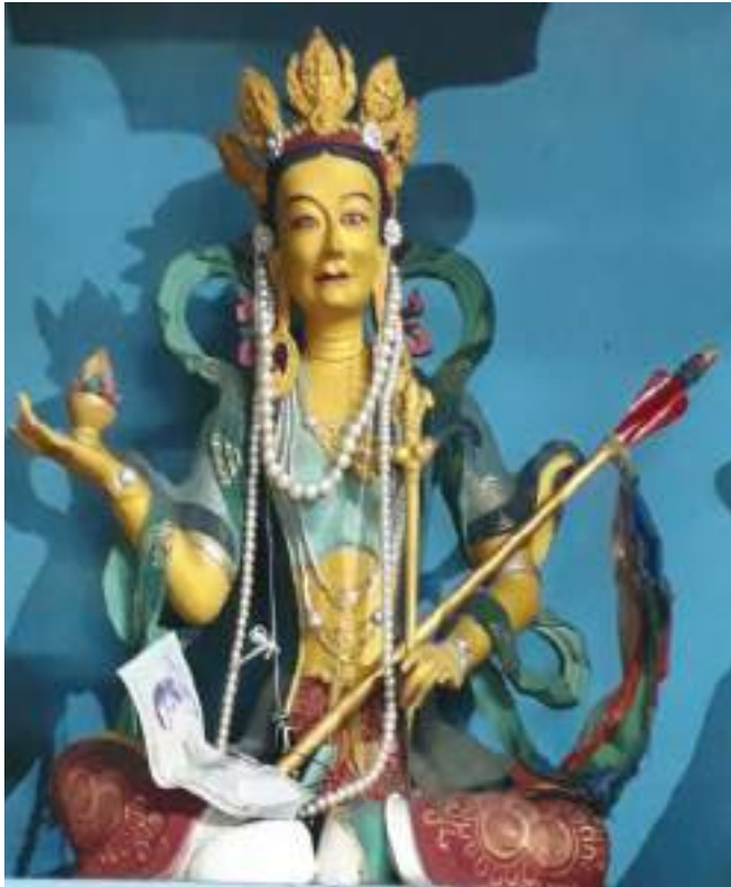
དཔལ་ལྷ་ལོངས་སྟོན་རྒྱལ་མོའི་སྐུ་འདྲ།

ཁམས་གསུམ་ག་ར་དབང་དུ་བསྐྱུས་བའི་ ལྷ་བའི་ཚྭ་མི་ཤེས་པར་ སྒྲེག་པའི་ཉམས་ཀྱིས་འགྲིངས་པའི་ཚུལ་ ཀྱིས་སྟེ་ བཞུགས་ཡོད་པའི་གྲུ། འཁོར་འབད་བ་ཅིན་ ལྷ་ལྷ་བདུད་བཙན་སྤྲོ་མོ་སོགས་གངས་མེད་ བསམ་གྱིས་མི་བྱབ་པའི་ཚྭ་ས་དང་བཙས་པ་ རང་བཞིན་གར་བཞུགས་ཀྱི་གནས་མཚྭ་ནས་ སྒྲོག་ལྷར་སྦྱར་ བའི་རྩ་འཕྱུལ་ལྷགས་ཆེན་དང་བཙས་པ་སྟེ་བསྐྱོར་ཏེ་ བཞུགས་ཡོད་པ་སྟེ་ མཛེན་རྟོགས་ཀྱི་ཚྭ་ནང་ལས་ གསལ་ལྷ་ཨིན་པས།