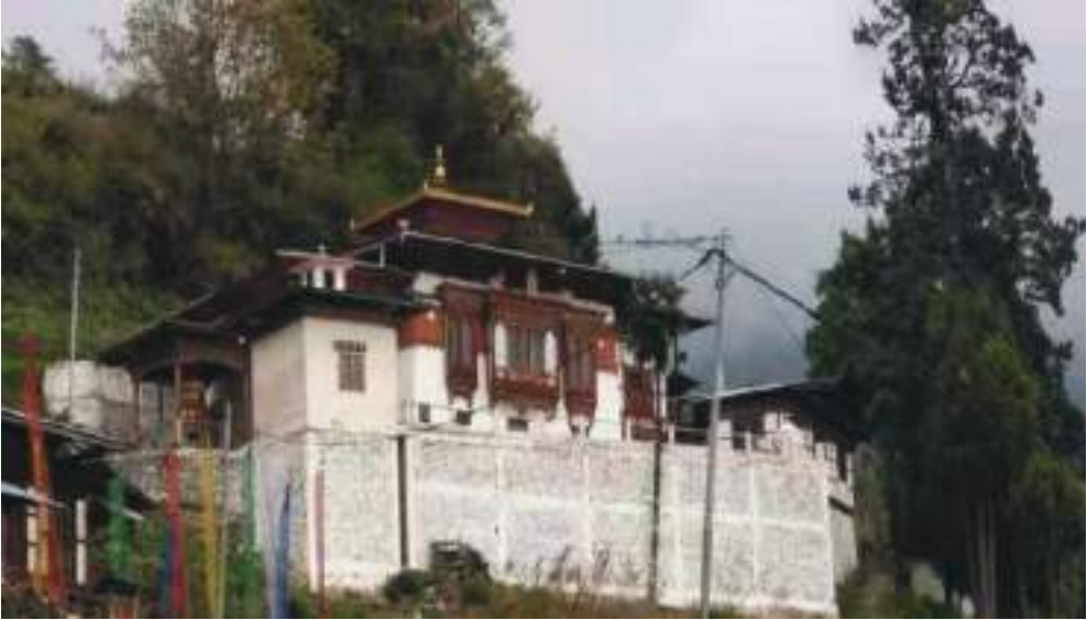
སྤང་ཉལ་ཁའི་ལྷ་ཁང་གི་མཐོང་སྒྲུང་།