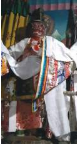
དགོན་བཙན་གྱི་ཀ་ཁྲབ།

པའི་བདག་པོ་དེ་ཚུ་གི་ འགལ་ཁྱེན་བར་ཆད་བསལ་ནི་ཟེར་ ཞལ་བཞེས་མཛད་དོ་བཟུམ་སྟེ་ དམ་བཞག་ མཛད་ཡོད་པ་སྟེ་ཨིན་པས།