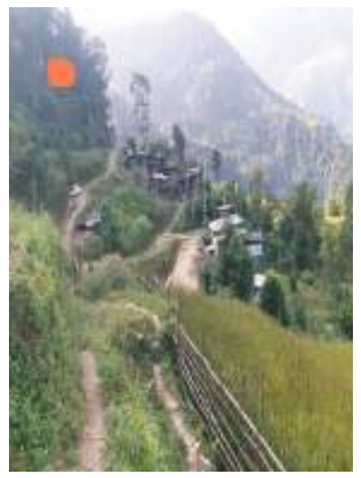
ཡུལ་ལྷ་གི་གནས་ཁང་།

དང་ཕུ་ ཡམ་རོར་བཟང་རྒྱལ་མོ་མཚོད་པའི་སྐབས་ རང་ལྷ་༩ པའི་ཆེས་ ༡༩ ལས་འགོ་བཙུགས་ཆེས་༡༤ རྒྱན་ ཉིན་གངས་གསུམ་གྱི་རིང་ལུ་ དམངས་མདའ་ཟེར་ གཡུས་སྐོ་འདི་ནང་གི་པོ་རྒྱས་རྒྱ་མདའ་རྒྱབ་ནི་ཡོད་ ཟེར་ཨིན་མས། དམངས་མདའ་རྒྱབ་པའི་སྐབས་ལུ་ མདའ་རྒྱབ་མི་གི་ དཔལ་གཟར་དང་ ཞབས་ཁྲ་རྒྱབ་མི་གི་རྩེ་དཔོན་མ་རྒྱ་ གྲུབ་གྲིབ་རྒྱ་ལུ་ རེག་རྟོག་མེད་པ་སྟེ་སྟོན་དགོཔ་སྟེ་ཨིན་མས། གལ་སྲིད་གྲུབ་གྲིབ་རྒྱ་ལུ་