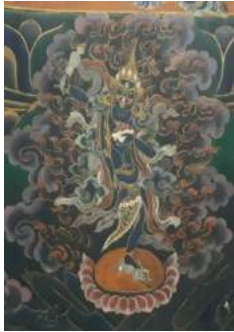
ལྷ་མོའི་སྐུ་འདྲ་དང་ལྷེབས་རིས།