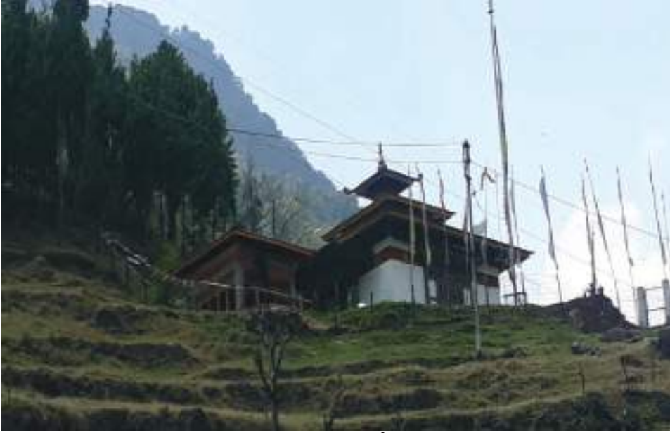
ཕང་ཁ་བདེ་ཆེན་ཅེ་ལྷ་ཁང་གི་མཐོང་སྒྲུང་།