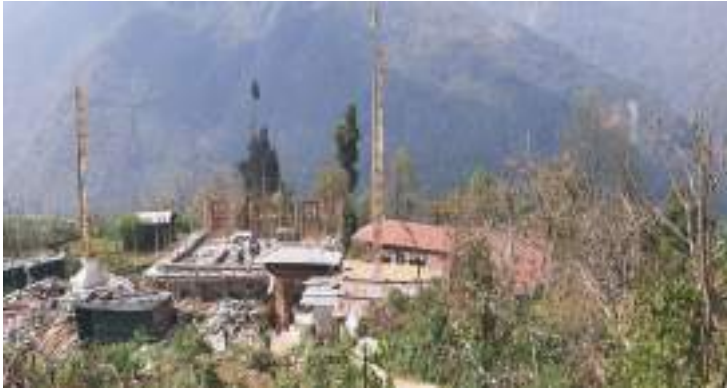
དགེ་འདུ་ལྷ་ཁང་གི་མཐོང་སྣང་།