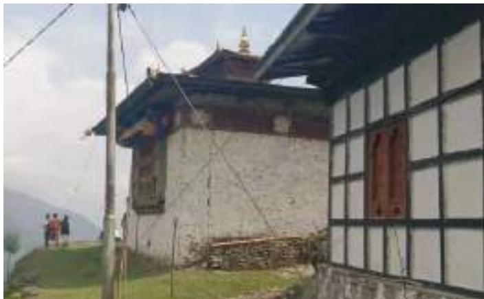
བཟ་གིས་སྐང་ལྟ་ཁང་གི་མཐོང་སྒྲུང་།

ད་རུང་ ཏེ་མ་བཟ་གིས་སྐང་ཟེར་མི་གི་ གཡུས་ཚན་ལུ་ཚུ་མེད་པར་ སྐམ་ངག་དབང་ཆོས་རྒྱལ་མཆོག་གིས་ ཚུ་བཏོན་ནི་དོན་ལུ་ སྐམ་གི་ཕྱག་ལུ་ གཏེར་གྱི་ཕུར་པ་ག་ཅིག་ཡོད་མི་འདི་ རི་པ་གི་ལོགས་ བོད་སྐྱོམ་ས་ ཟེར་མི་སྐབ་ཁང་ལས་ཚུར་ གཡུ་བཀོ་བཏང་སྟེ་ ཕུར་པ་གི་རྟིང་ཤུལ་བདེ་ལྟེ་སྐམ་ཕྱོན་མ་སྟེ་ བཟ་གིས་སྐང་ ལུ་ག་ཏེ་འཆོལ་རུང་མེད་པར་ ལོག་ད་གར་ལུ་ཕྱོན་མ་ད་ ཕུར་པ་དེ་བཟ་གིས་སྐང་ལུ་ ལུང་བསྟན་མེད་པར་ ད་དཀར་ལུ་ཡིན་པས་ཟེར་གསུངས་ཏེ་ དར་དཀར་གསལ་ལྟ་ཁང་གི་ མགོན་ཁང་ཟུར་ཁར་ རྩོམ་རོང་ནང་ ལུ་ཟུབ་སྟོད་ལྷག་ཟེར་ཡིན་པས་ དེ་ནང་ལས་ཕུར་པ་ལོག་བཞེས་པ་ད་ གྲུབ་ཚུ་འཐོན་ཡོད་མི་འདི་ ད་རེས་ བསམ་པ་ ལྟ་ཁང་གི་སྐམ་ལྟག་པ་རྩོམ་གིས་ དེ་གུར་མཆོད་རྟེན་ཅིག་བཞེས་སྟེ་ གྲུབ་ཚུ་མཆོད་རྟེན་ཟེར་མིང་ བཏགས་ཡོད་པའི་ཁར་ གཏེར་ཕུར་པ་དེ་ཡང་ ད་ལྟོ་ལྟ་ཁང་ནང་ལུ་ནང་རྟེན་སྟེ་བཞུགས་ཡོད་ཟེར་ ངག་རྒྱན་ གྱི་ལོ་རྒྱུས་སྟེ་བཤད་ནི་འདུག། ཡིན་རུང་ལྟ་ཁང་འདི་ གཡུས་ཚན་འདི་ནང་གི་ མི་མེར་ག་རའི་དོན་ལུ་ ཕྱག་ དང་མཆོད་པ་ཕུལ་ཏེ་ སྐབས་དང་མགོན་ལུ་མི། གཤེན་པོ་དེ་གཤམ་དགེ་ཅུ་བསྐྱབ་ནི་དང་ སྐྱེས་ལྟ་ལུ་ལྟ་ གསོལ་ནི་ཚུ་ག་ར་ ལྟ་ཁང་འདི་ནང་ལུ་ འབད་ནི་ཡོད་ཟེར་བཤད་པ་ཡིན་པས།