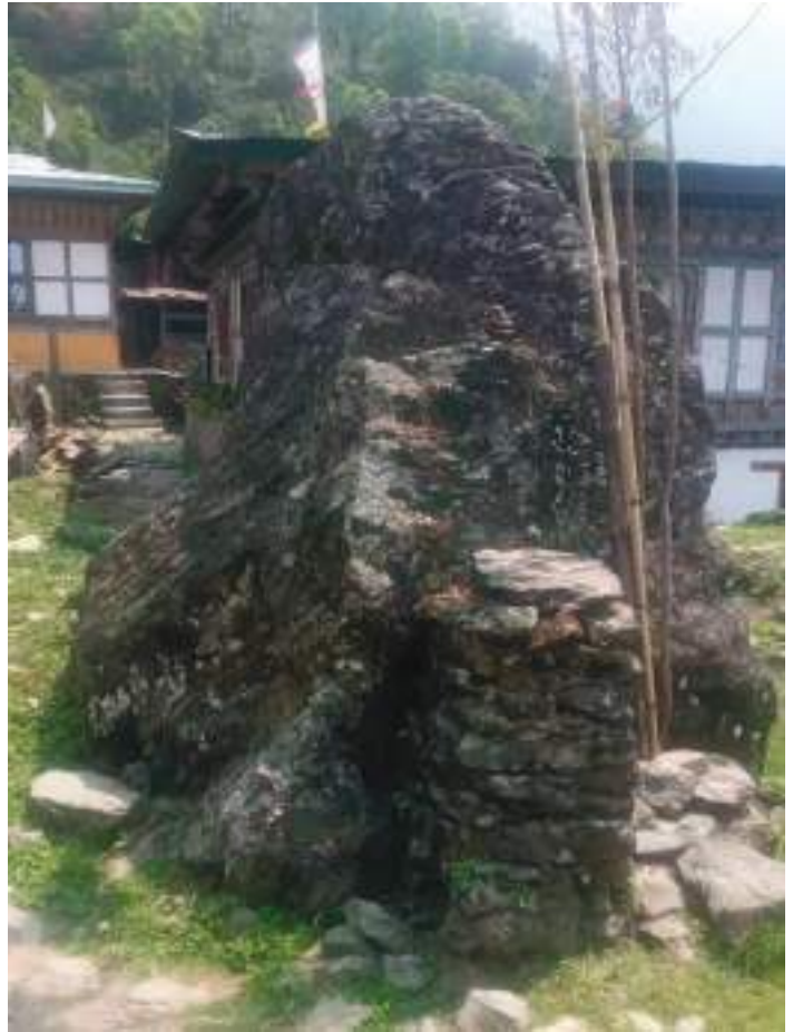
གཞི་བདག་ཡམ་གི་གནས་ཁང་།

གནས་ཁང་འབད་བ་ཅིན་ སྤྱན་འཛེན་ ལས། (དཔར་ལོ་མེད་ ཤོག་གི་རྒྱ་བ་ )“རྒྱུ་ སྤྱན་ཚྲིག་འདྲིན་ཡོན་དཔལ་ འབྱོར་རྒྱས་པའི་ཚོ། །ལྷ་ཡི་ཞིང་ཁམས་ དངོས་སུ་འཕོས་འདྲ་བའི། །བལྟ་ན་སྤྱག་ དང་དབྱེ་བ་མ་མཆིས་པའི། །རིན་ཆེན་ཞལ་ ཡས་ཁང་གི་སྤྱན་པའི་དཔོན། །སྟོང་པ་ ཡུམ་གྱི་རོ་བོ་ཡག་མོའི་ཚུལ། །སྤྱན་སྤྱེའི་ འདྲིན་ཡོན་བཟང་མོ་མཛེས་སྤྱག་མ། །བལྟ་ བས་ཚོག་ཤེས་མེད་པའི་འཁོར་གྱིས་ བསྐྱོར།” ཟེར་གསལ་དོ་བཟུམ་སྤྱེ་ བདག་པ་སྤྱི་འོག་གི་ས་གནས་ སྤྱན་སྤྱེ་ ཁའི་གཡུས་ཚན་གྱི་སྤྱག་ལུ་ རོ་ཕུང་སྤྱོམ་ ཅིག་ཡོད་མི་ གཞི་བདག་གི་གནས་ཁང་ ཡིན་མ་སྤྱེ་ བདག་པ་སྤྱི་འོག་གི་ཚྲིག་ས་པ་ པ་རྒྱ་ཆེ་རིང་གིས་བཤད་པ་མས།