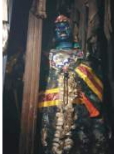
ནུམ་པ་དང་སྐྱེ་མདོག་ཕྱག་མཆོན།