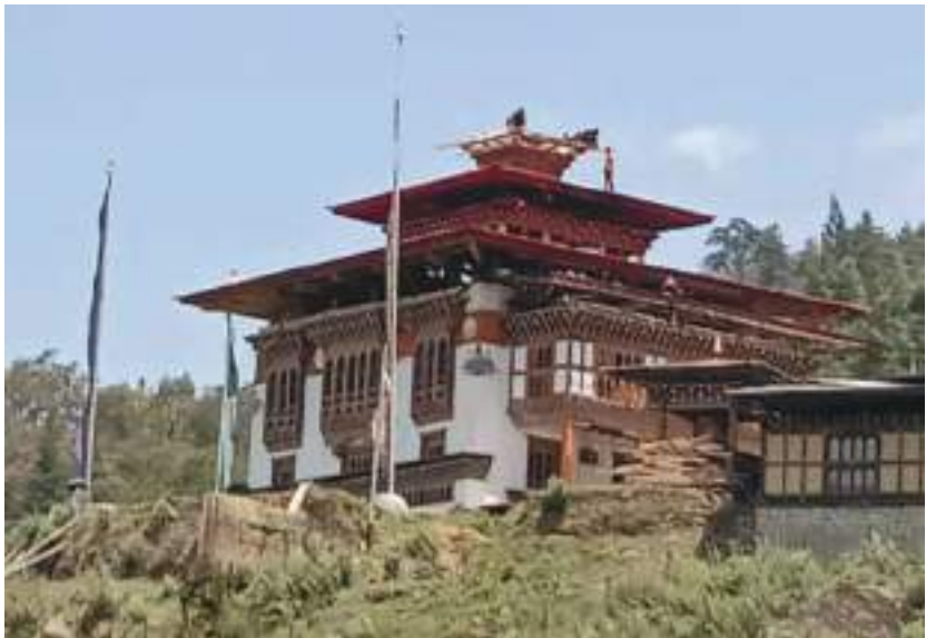
བྱ་ན་ཁ་ལྷ་ཁང་གི་མཐོང་སྣང་།

གཡུས་སློ་འདི་ནང་གི་ གནས་བདག་གཞི་བདག་ཟེར་རུང་ སྐྱེས་ལྷ་ཡུལ་ལྷ་ཡང་ ཐོ་ལྷ་རྟ་དམར་རང་བཅན་ དང་སྤྲན་མོ་དེ་གཉིས་ཡིན་མས། བྱ་ན་ཁ་གཡུས་ཚན་འདི་ནང་ལུ་ ཁྱིམ་གྲུང་པ་ ༡༩ དེ་ཅིག་གི་ མི་སེར་ ག་རའི་དོན་ལུ་ ཡུག་དང་མཆོད་པ་སྤུལ་ཏེ་ སྐྱབས་དང་མགོན་ཞུ་ནི། གཤིན་པོའི་དགེ་མཉམ་དགེ་ཙམ་བསྐྱབ་ནི་དང་ སྐྱེས་ལྷ་ཡུལ་ལྷ་གསོལ་ནི་ཚུ་ག་ར་ལྷ་ཁང་འདི་ནང་ལུ་སྤུལ་ནི་ཡོད་ཟེར་བཤད་ནི་འདུག།